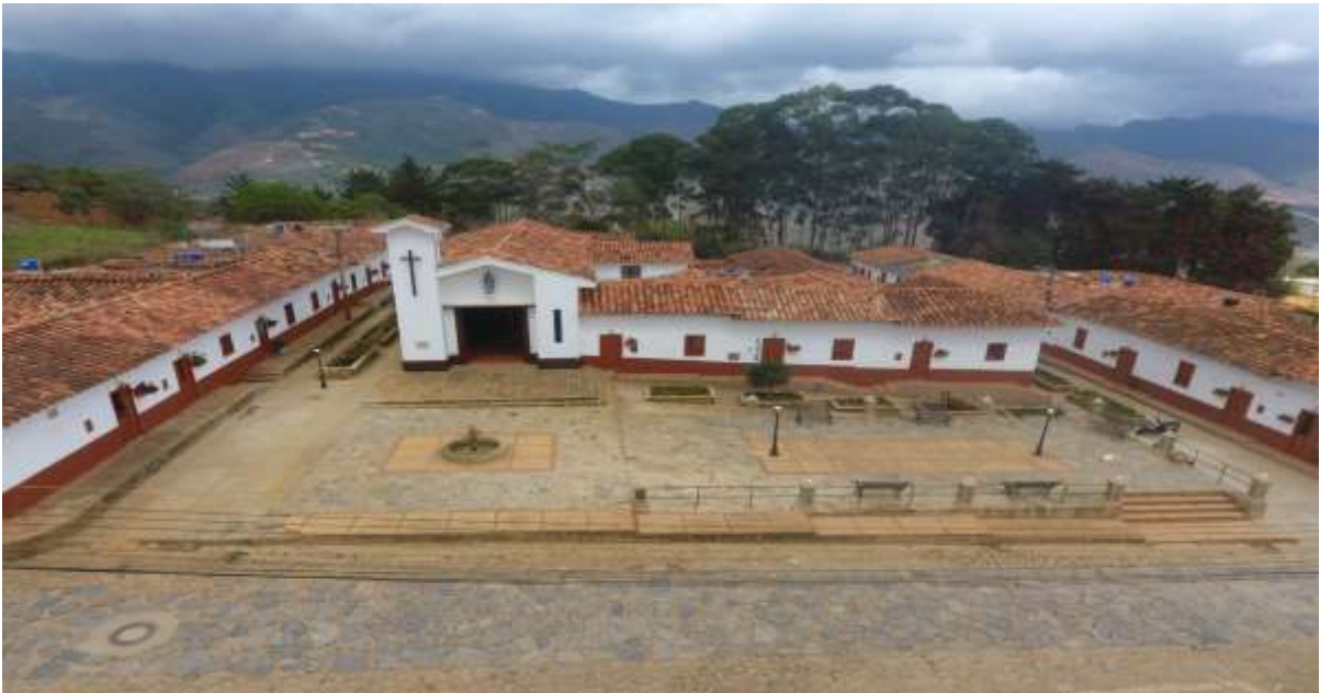
Barrio San Vicentico - Zapatoca